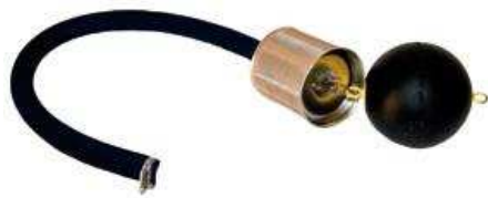
Special suction set fine filter