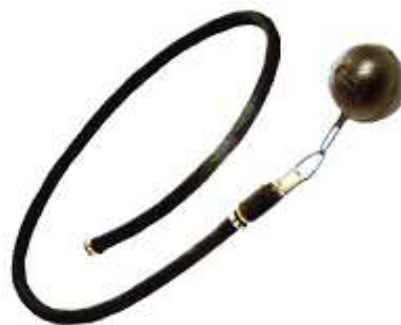
Special suction set coarse filter